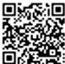
Online Notice Board

https://www.racingrulesofsailing.org/documents/15056/event